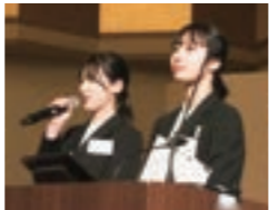
美作大学の学生による司会の様子