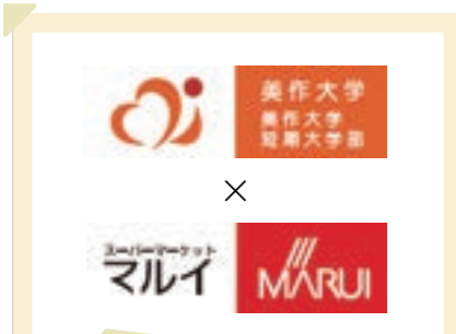
2025/7月 美作学園と包括連携