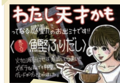
2025/12月 POP大賞3年連続受賞