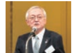
エスマート寺谷社長の政策発表