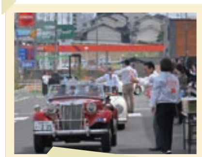
2025/4月 ベッキオバンビーノ(WL)