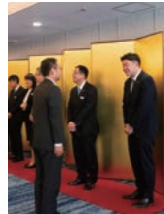
マルイグループ役員全員でお出迎え

マルイグループ役員が揃って皆様をお出迎え。新たな年を寿ぐと共に、お互いの発展を誓い一層の絆を深め合う会です。毎年恒例のお楽しみ抽選会では、会長社長お二人の掛け合いにもご期待!