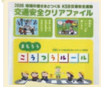
2025/4月 交通安全クリアファイル