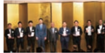
2024年度マムハート賞などを受賞されたお取引先の皆様