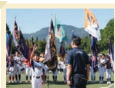
2025/8月 マルイ杯軟式野球大会後援