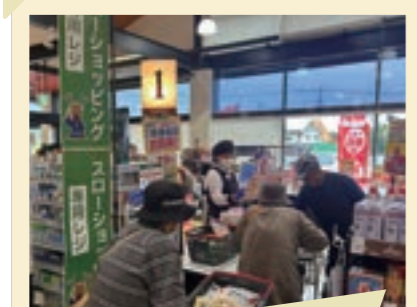
2025/5月 スローショッピング(車尾・勝北)開始