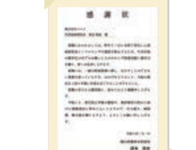
2025/12月 鳥インフル対応で感謝状受賞