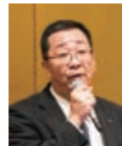
情報交換会での政策進捗の発表