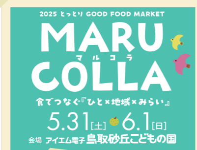
2025/5月～6月 マルコラ開催