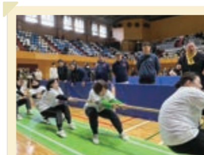
2026/2月 綱引き大会(男女)参加、 次回より部活?