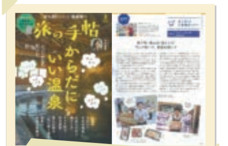
2025/12月 全国スーパーマーケット大全(書籍)、 旅の手帖(雑誌)に掲載