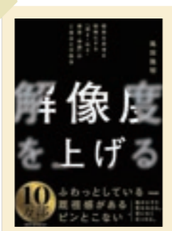
2025/4月～ 社長から店長の誕生日に本を送る