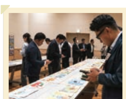
2025/9月 絵画コンクール