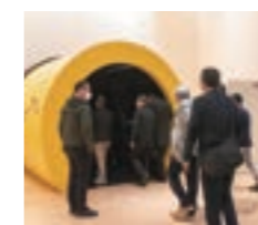
グリコピア、お菓子の世界へようこそ!

主にお取引先様などの現場視察や体験を企画。丸1日行動を共にすることでフラットなお付き合いも。今年は「グリコピア神戸」と「神戸三田プレミアムアウトレット」への視察でした。帰りに思わぬハプニング?!もありましたが、記憶に残る研修会となりました。