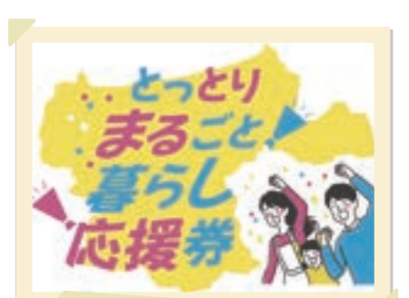
2026/4月 とっとりまるごと暮らし応援券発売