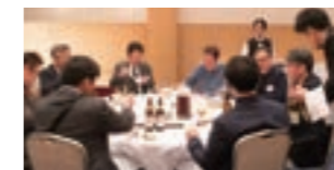
好評だった神戸西神オリエンタルホテルでの昼食