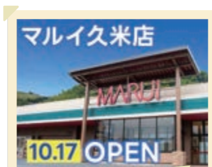
2025/10月 久米店オープン