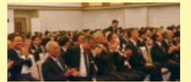
抽選会会場の様子