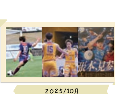
2025/10月 湯郷ベル、トライフープ、リベッツ 冠試合開催