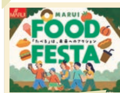
2025/11月 フードフェスタ開催