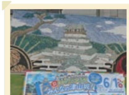
2025/9月 ペットボトルキャップ津山城に協力