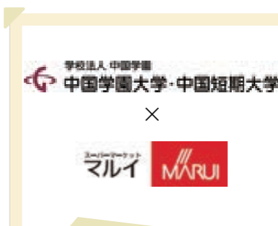
2026/3月 中国学園と包括連携