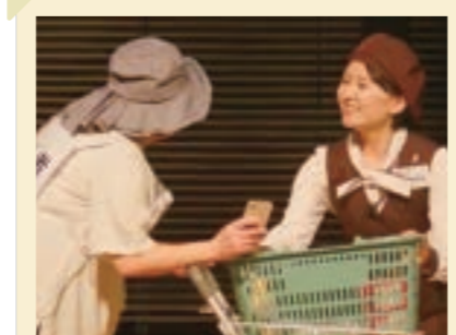
2025/6月 チェックーフエスティバル 中国地区代表として全国大会出場