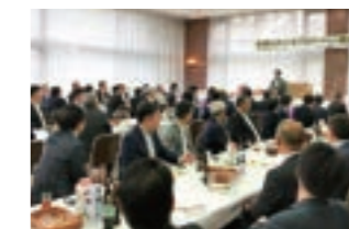
優勝賞品はサッカーW杯ツアー!?

5回毎に開催される記念大会は160名近くの方が参加、豪華賞品をご用意。参加賞も「マルイならではの新鮮な食材」とご好評。コンペの前日には大前夜祭と称して、肩が触れ合う距離感でのそずり鍋に舌鼓み、毎年大盛り上がりです。