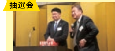
社長・会長の息の合った進行