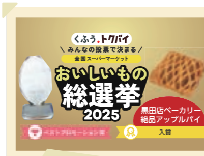
2026/1月 美味しいもの総選挙で ベストプロモーション賞受賞、 スイーツ部門賞受賞