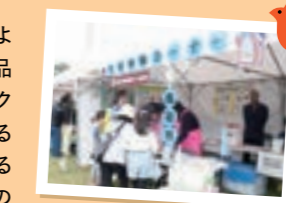
おいしく食べる 学びの場の提供

今年も食品メーカー各社によるメニュー提案や、人気商品&新商品の試食、ワークショップなどの味わって学べる企画をはじめ、100を超える食と体験が大集合。大勢のお客様にグルメと体験を楽しんでいただきました。