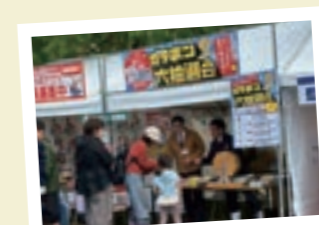
マルイの店長大集合!