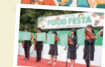
地元学生のアンサンブルコンサート