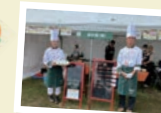
味の素(株)様×津山東高等学校様の レシピコンテストメニューの試食提供