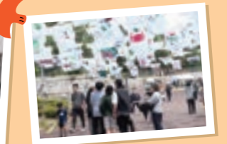
マルコラ×鳥取市立浜坂小学校 Tシャツアート展!